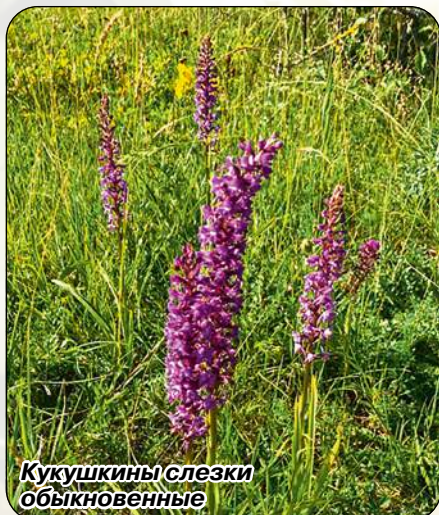
Кукушкины слезки обыкновенные

Так говорил об орхидеях Георг Румф, голландский ботаник, живший в 17 веке. Они «демонстрируют своё благородство, предпочитая жить высоко на деревьях», — говорил он об открытых в то время видах эпифитных орхидей. Эпифиты — это растения, которые живут на других растениях (не стоит путать с паразитами), и к ним относится большая часть тропических и субтропических видов из семейства Орхидные.