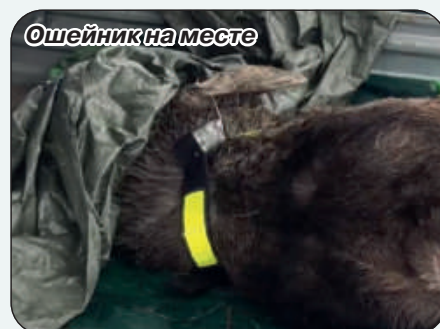
Ошейник на месте

ряженными транквилизаторами, обездвигивающие животных.