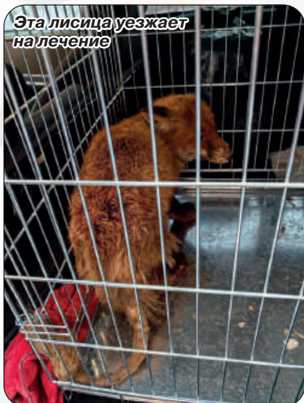
Эта лисица уезжает на лечение

В этой ситуации специалист внимательно изучает местность и об-