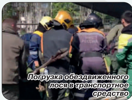
Погрузка обездвиженного лося в транспортное средство