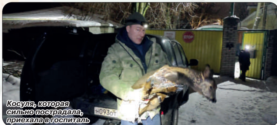
Косуля, которая сильно пострадала, приехала в госпиталь