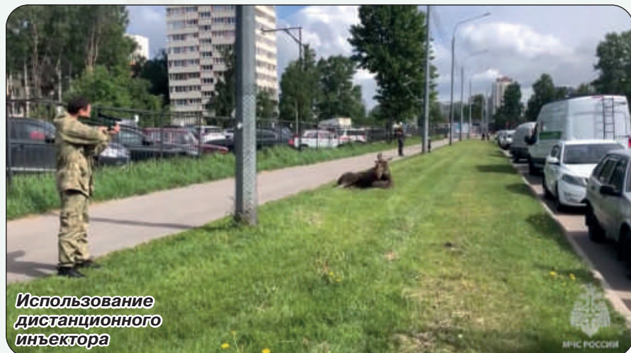
Использование дистанционного инъектора