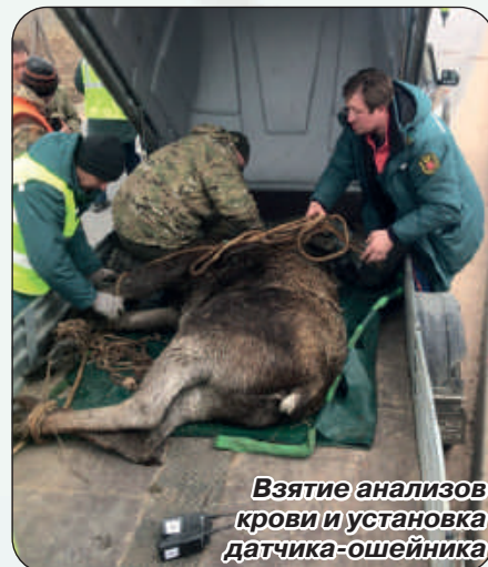
Взятие анализов крови и установка датчика-ошейника

Арсенал, который используется при отлове животных, может включать в себя различные виды сачков (для разных видов животных), ловчие петли, ловчие сети, которые можно натянуть, а также сетеметы. Для крупных животных, конечно, используются специальные ветеринарные ружья стреляющие шприцами, сна-