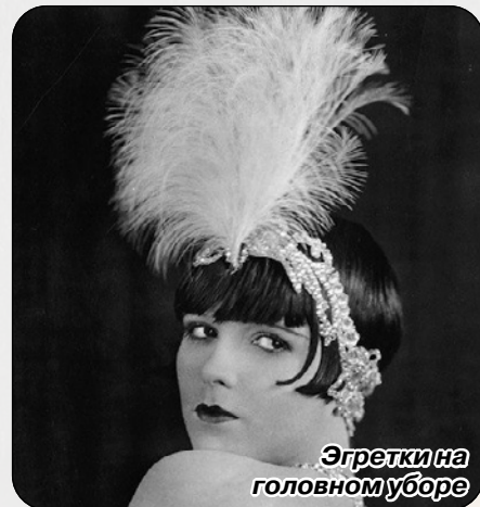
Эгретки на головном уборе

дней. Вероятное место гнездования в заказнике «Сестрорецкое болото» – это приустьевая часть реки Черная, в тех же местах устраивают гнезда и серые цапли.