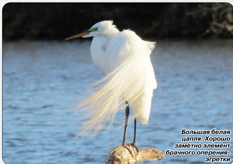
Большая белая цапля. Хорошо заметно элемент брачного оперения – эгретки

Использованный при написании статьи фотоматериал находится в свободном доступе в сети Интернет. Авторство неизвестно.