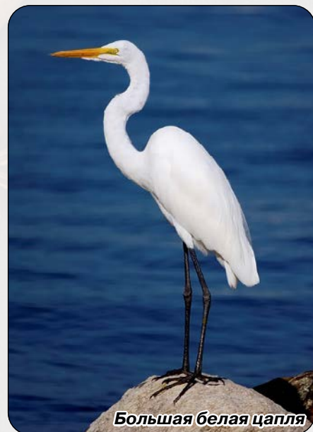
Большая белая цапля

Если же все-таки цапля решится поселиться на дереве, то сооружает гнездо в форме перевёрнутого конуса с просвечивающими стенками из сухих прутьев и колючих ветвей. В сооружении гнезда принимают участие оба партнёра: доставка гнездового материала в значительной степени лежит на самце, а его размещение и утапывание – на самке. В кладке 4–5 зеленовато-голубых яиц величиной с куриное. Кладку насиживают обе птицы в течение 25–26