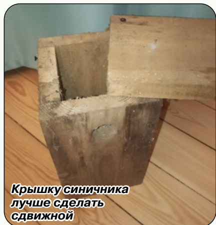
Крышку синичника лучше сделать сдвижной