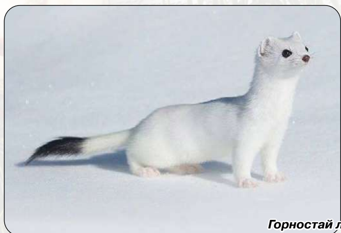
Горностай летом и зимой

Ласки территориальны – территория одного самца граничит (либо включает в себя) территории нескольких самок. Весной или в начале лета происходит спаривание, и дальнейшие заботы по выведению потомства ложатся на плечи и лапы самки. В помете обычно 5-6 детенышей, которых самка рождает в укрытии. Сами ласки не роют норы, а пользуются готовыми, сделанными грызунами. Гнездовую камеру выстилают сухой травой и шкурками убитых жертв (что, опять-таки, довольно красноречиво).