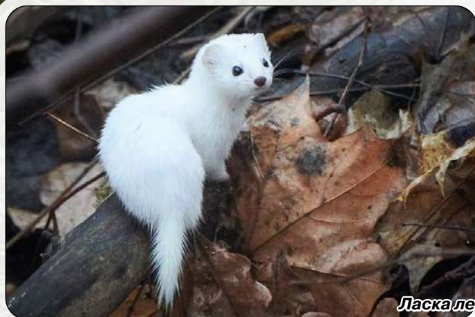
Ласка летом и зимой